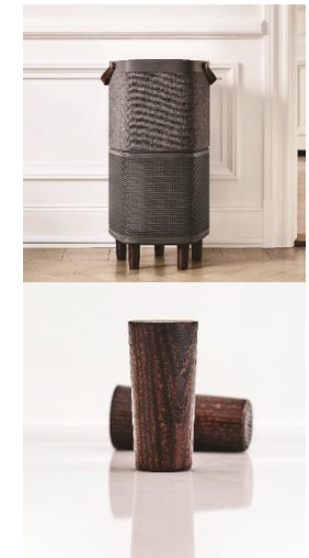
Holzfüße aus Walnuss 5 Stück im Set

Modell: ACLDB1 PNC: 900 923 201 UVP: 49,99 €